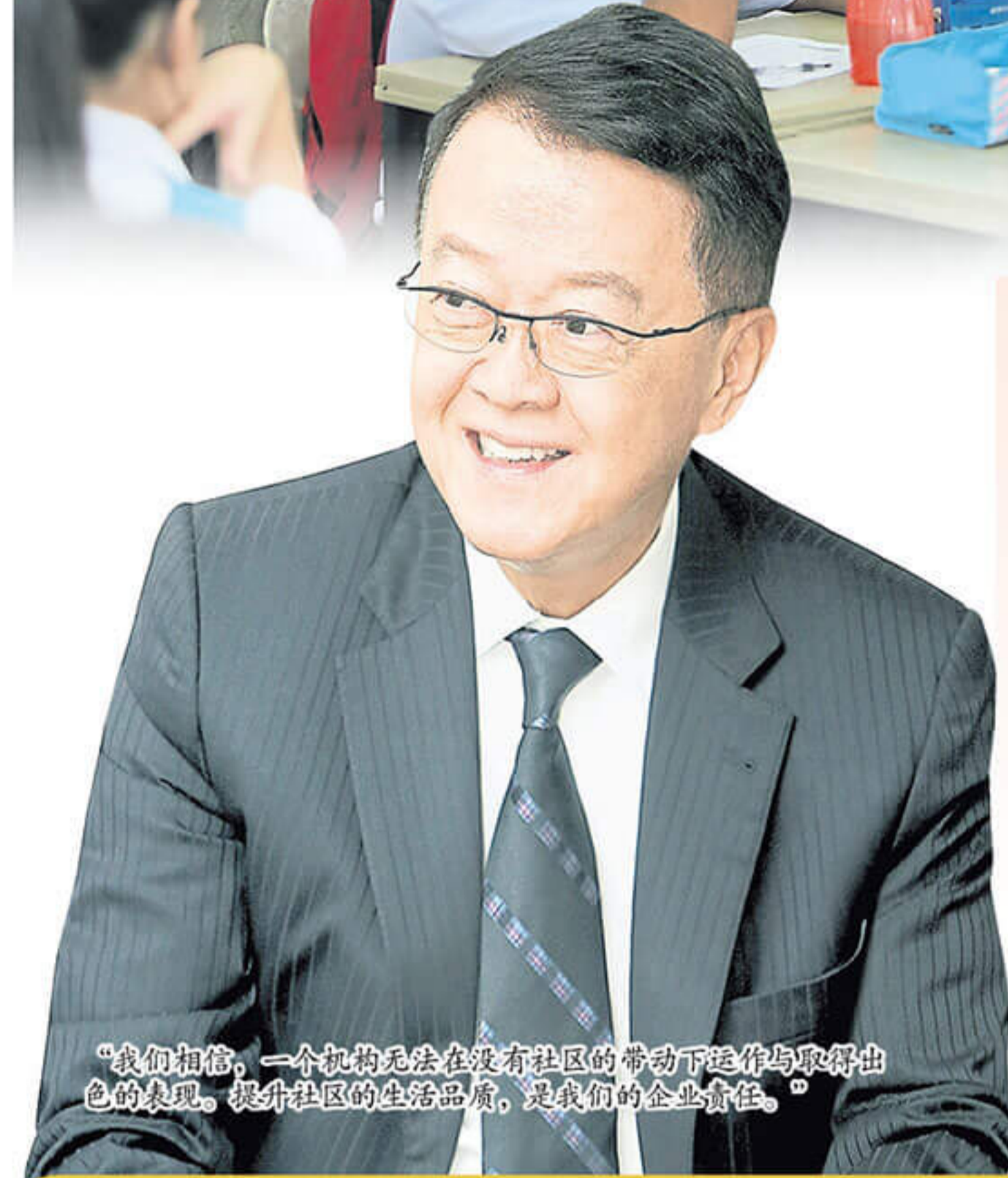
“我们相信,一个机构无法在没有社区的带动下运作与取得出色的表现。提升社区的生活品质,是我们的企业责任。”