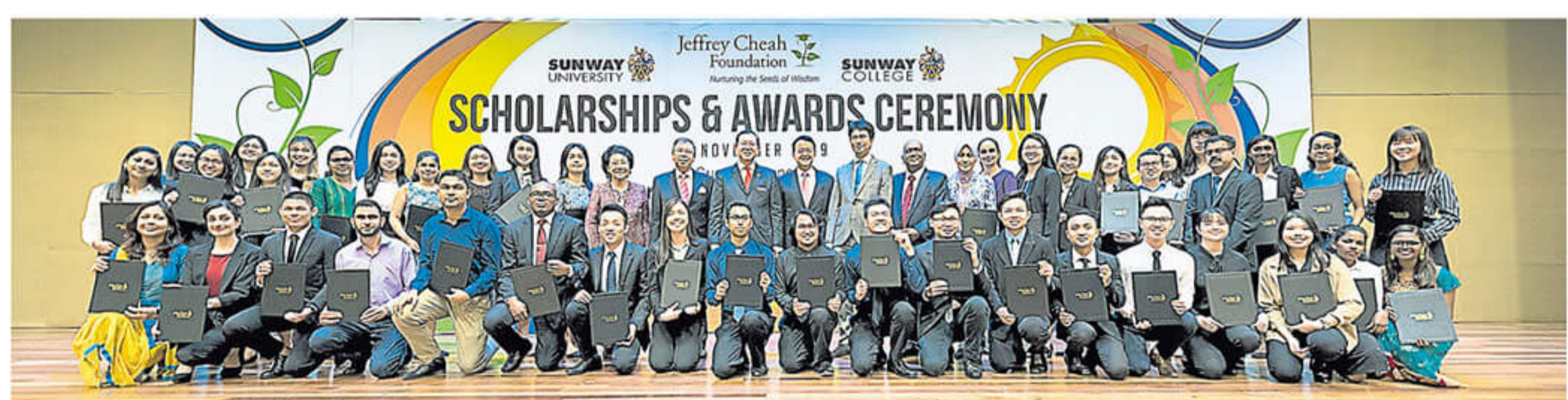
▲截至2019年,谢富年基金会拨出了超过4亿8200万令吉的奖学金与助学金。

整体上,谢富年认为双威集团成功为医疗科学与服务领域打造优秀的生态系统,更成功吸引许多医生及研究人员回马。